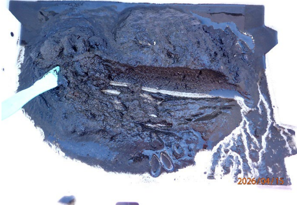
Prøvestasjon 4: Mudder med sagmugg. Mørk farge og noko lukt i prøve med mjuk konsistens